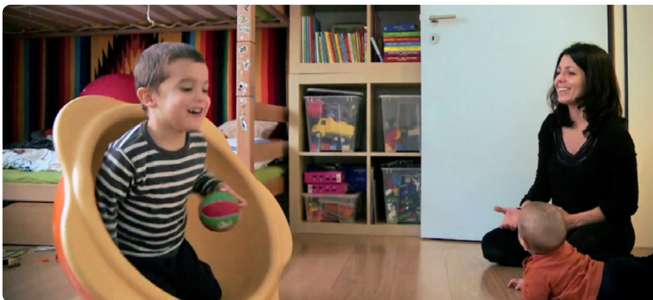
Motorische Spontaneität im Spiel mit der Mutter. Szene aus dem Video «Drehschale»: www.kinder-4.ch/filmfinder/drehschale