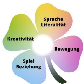
Abbildung 1: Die vier Erfahrungsfelder

Im MegaMarie plus Programm symbolisiert ein vierblättriges Kleeblatt Erfahrungsfelder und Ausdrucksformen, die für Kinder in den ersten Lebensjahren hoch bedeutsam sind: «Spiel», «Sprache», «Kreativität» und «Bewegung» (Abbildung 1).